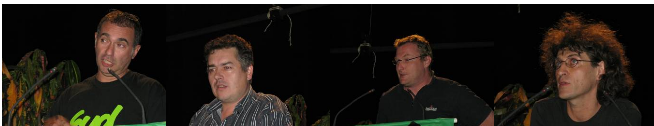
KandidatInnen der Sektionen und späteren Mitglieder des neuen Vorstands