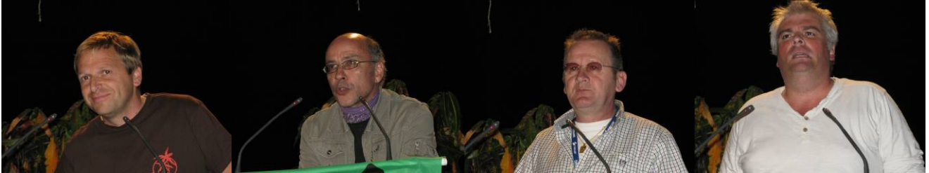
KandidatInnen der Sektionen und späteren Mitglieder des neuen Vorstands

Gewerkschaften, die im Bereich des Transports / LKW / Stadtverkehr (Bus, Metro, Tram) / Fähren / Taxis/ aktiv sind und Sud-Solitaires, als einheitliche übergreifende Gewerkschaftsbewegung, in der sich die verschiedenen gesellschaftlichen Bereiche/ öffentlicher Dienst/ Industrie/ Chemie usw. zusammenschließen.