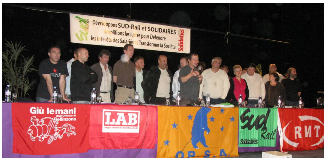
Der alte und der neue Vorstand von Sud-Rail

Sud-Rail und Solidaires entwickeln - die Kämpfe verbreitern für die Verteidigung der Interessen der Lohnabhängigen und die Transformation der Gesellschaft